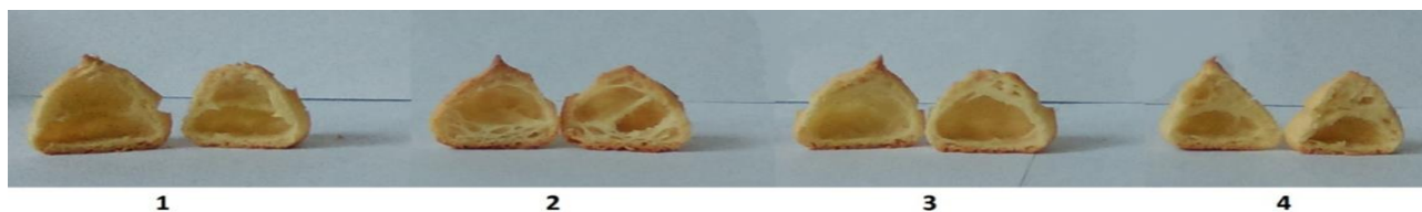
Рисунок 3. Выпеченный заварной полуфабрикат (вид в разрезе) с применением 15% просяной муки и миндальной муки в количестве: 1 – контроль (без внесения миндальной муки); 2 –10%; 3 –20%; 4 –30%

В качестве контрольных вариантов выбран: контроль - образец заварного полуфабриката с применением пшеничной муки и 15% просяной муки. При анализе качества кондитерских изделий, приготовленных с использованием муки миндаля, можно отметить ее высокую значимость для формирования качественных показателей заварных полуфабрикатов и образования полости внутри изделия.